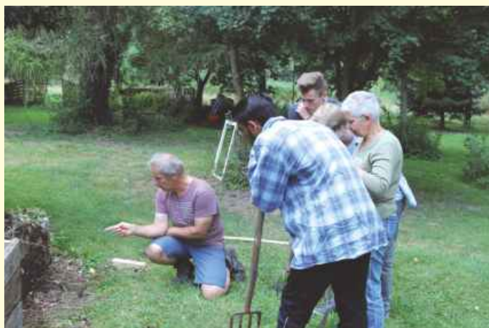
Ein Fachmann ist anwesend, der das Versetzen des alten, etwas vernachlässigten Komposthaufens begleitet und kommentiert.

Szenenwechsel. Schüler der Gruppe ‚Fridays for Future‘ kommen zum Aktiv-Hof mit dem Rad aus Osnabrück. Dabei auch ein Schüler aus Hannover und eine Schülerin aus Bramsche. Da sie in den Ferien nicht streiken können, wollen sie arbeiten und was lernen, ist ihre Begründung. Wir machen das Thema ‚Kompost‘ zum Mittelpunkt. Eine Gruppe zieht am Grundstücksrand Brennnesseln aus der Erde und streift die Blätter ab, um später eine Lauge anzusetzen. An anderer Stelle wird eine neue Kompostkiste gezimmert.