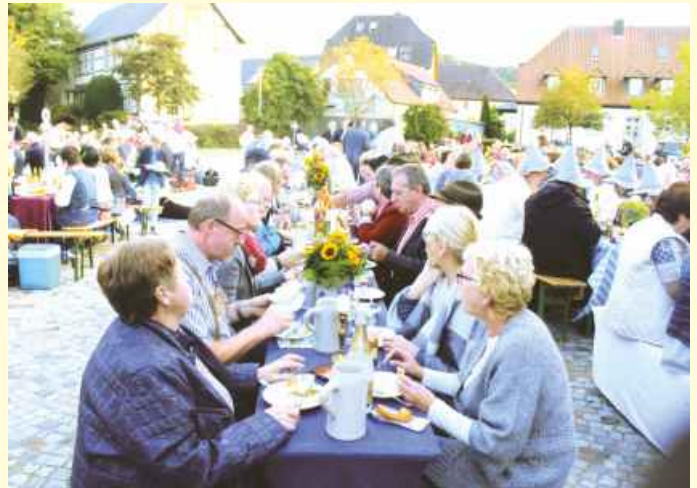
Aufnahme von der ersten Biss-Fest Veranstaltung.

Und so geht es: Die Bänke und Tische werden von „Biss-Fest“ gestellt und können für eine Spende von 8€ pro Platz gebucht werden. Es können Einzelplätze oder für Gemeinschaften ganze Tische (8 Plätze pro Tisch) gebucht werden.