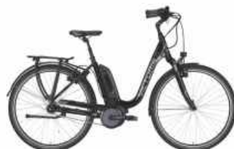
Victoria e. Trekking 7.5 C

Motor: Bosch Mittelmotor 400 Watt hydraulik Bremsen, Rücktritt SHIMANO "Nexus", 7-Gg.