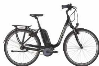
Victoria e. Trekking 7.5 C

Motor: Bosch Mittelmotor 400 Watt hydraulik Bremsen, Rücktritt SHIMANO "Nexus", 7-Gg.