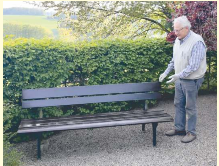
VORSICHT frisch gestrichen.