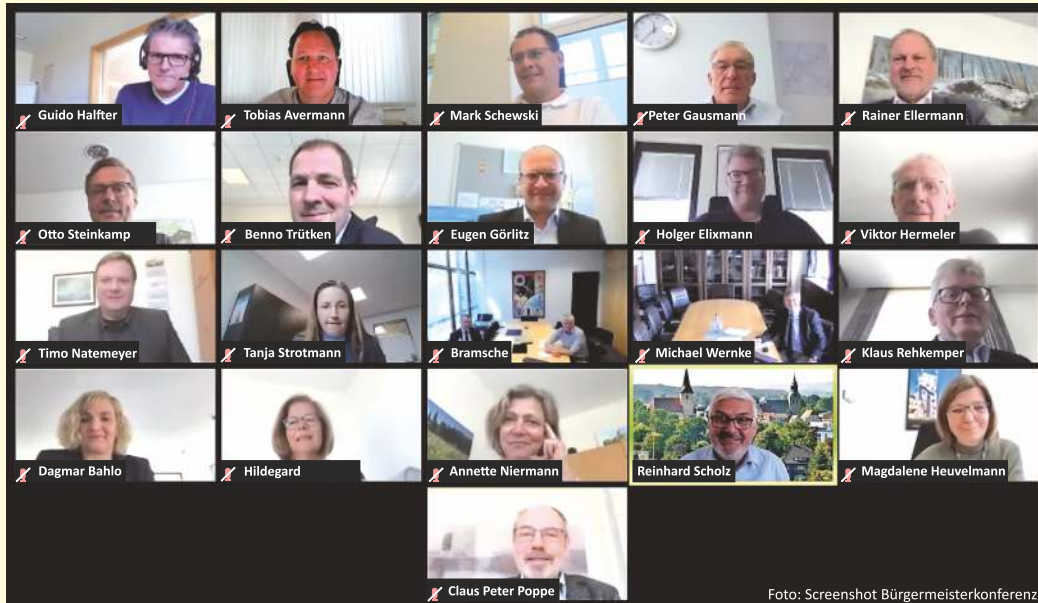
Die Bürgermeisterinnen und Bürgermeister der kreisangehörigen Städte, Gemeinde und Samtgemeinden tagen regelmäßig per Videokonferenz.

Die Bürgermeisterkonferenz ist ein langjähriges Instrument zur Abstimmung der Hauptverwaltungsbeamten im Landkreis Osnabrück. Erstmals seit Beginn der sogenannten Corona-Krise trafen sich die Bürgermeisterinnen und Bürgermeister virtuell zu einer internen Bürgermeisterkonferenz. Denn auch wenn die Rathäuser im Osnabrücker Land, bis auf für dringendste Anliegen, aktuell geschlossen sind, wird in den Kommunalverwaltungen weitergearbeitet und das zum Teil unter erschwerten Bedingungen. Umso wichtiger ist der Austausch untereinander.