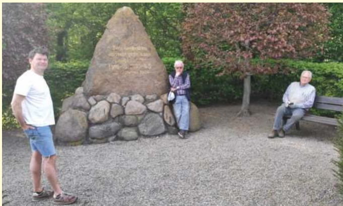
Sängerstein nach der Pflege.

Nach der turnusmäßigen Pflege des Sängergedenksteins schmetterten Sänger des 2. Tenors ein fröhliches Lied vom Berg herab ins Tal. Alles schön mit gebotenem Abstand versteht sich!!!