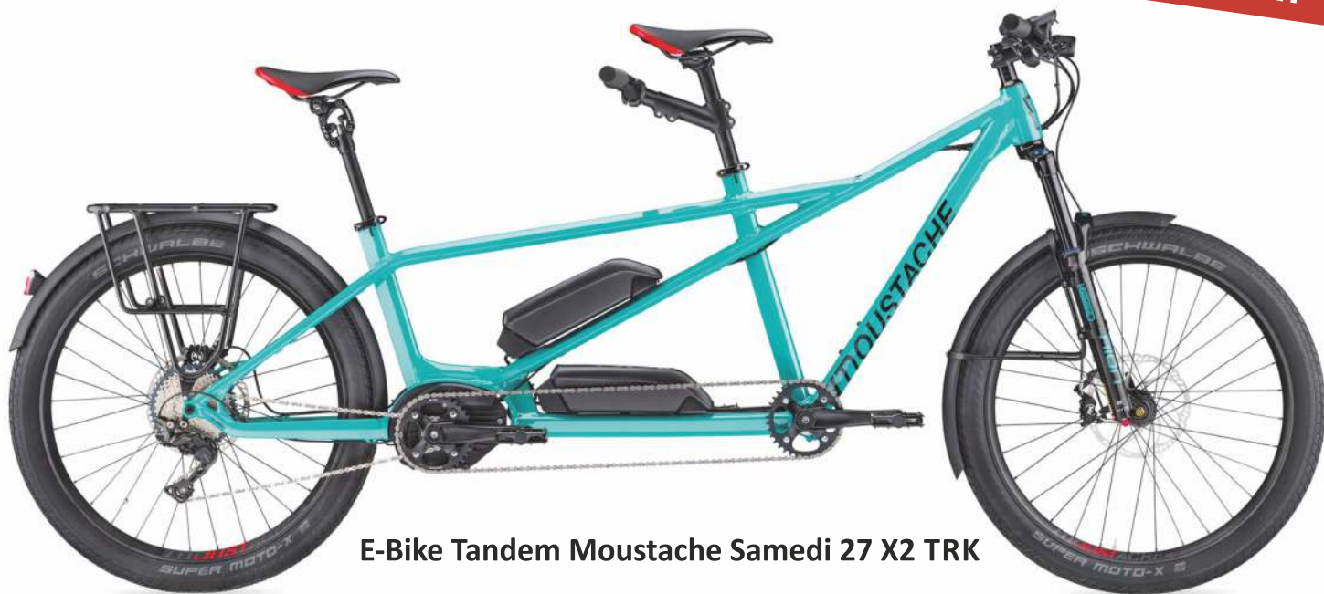
E-Bike Tandem Moustache Samedi 27 X2 TRK