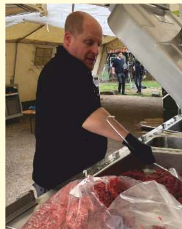
Sanitätsdienste wie hier 2019 beim 24H-Mountainbike-Rennen am Alpfsee sind ein wichtiges Betätigungsfeld im Ehrenamt.