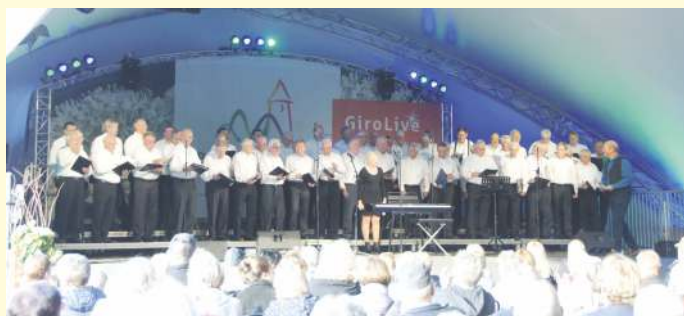
LaGa Bad Iburg - nach solchen Auftritten sehnt sich jeder Chor.

Die Sänger des MGV Fidelitas Holte haben, wie andere Gemeinschaften, eine Zwangspause einlegen müssen. Auch verschiedene Lockerungen der erlaubten Verhaltensweisen konnten nicht wirklich nutzbar umgesetzt werden. Es gab und gibt bis heute kaum eine Möglichkeit mit einem Chor mit über 30 „Singwilligen“, bei Einhaltung der erforderlichen Abstandsvorschriften, ein sinnvolles Übungssingen durchzuführen. In dieser enthaltssamen Zeit blieb, neben sporadischen Mail-, Whatsapp oder Telefonkontakten, lediglich die Pflege des Gedenkplatzes.