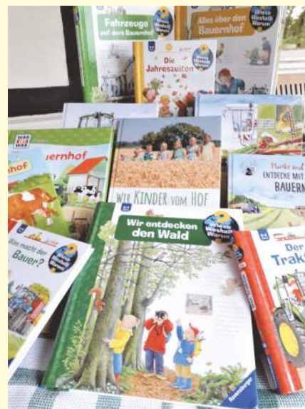
Text & Foto: LandFrauenverein Schledehausen/Almut Detert

Die 2019 veröffentlichte Stavanger Erklärung, die von über 130 Leseforschern aus Europa unterzeichnet wurde, macht deutlich, dass Bücher für Kinder unverzichtbar sind, um Kernkompetenzen wie Sprechen und Lesen zu erwerben und zu festigen.