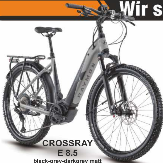
CROSSRAY E 8.5 black-grey-darkgrey matt