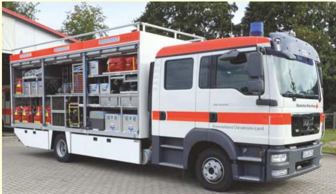
Neueste Fahrzeuge für den Einsatz im Katastrophenschutz: Das DRK Osnabrück-Land verfügt über eine herausragende Ausstattung.