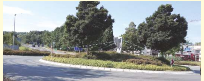
Schützenschmuck und doch kein Fest.