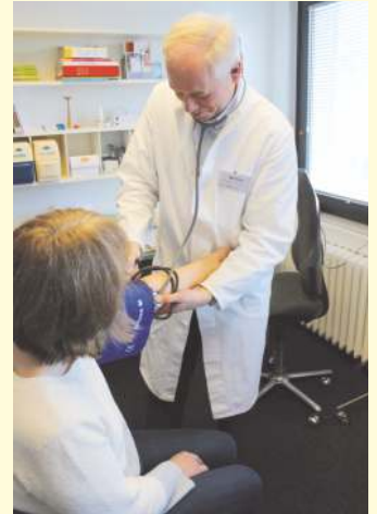
Behandlung während der offenen Sprechstunde.

Seit über zehn Jahren gibt es das Projekt zugunsten bedürftiger Menschen ohne Krankenversicherung. Schätzungen zu Folge leben in Deutschland bis zu einer halben Millionen Menschen in der Illegalität und damit ohne Zugang zur me-