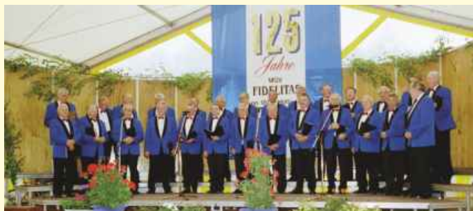
125 Jahre Männergesangsverein Fidelitas von 1877 Holte.

Für interessierte Neubürger und zur Erinnerung aller Anderen kommt hier noch etwas „Chor-Historie“. Bei der Jahrhundertwende kam auch ein besonderes Jubiläum näher.