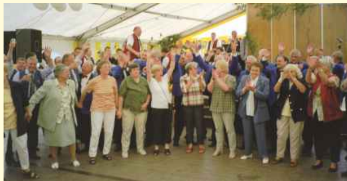
Der Jubiläumschor im Zelt.

Es mußte jegliches Gestühl und Sitzgelegenheit zusätzlich herangeschafft werden. Die spät eingetroffenen Zuhörer saßen schon außerhalb und nicht wenige begnügten sich sogar mit Stehplätzen. Der Sonnabend gehörte dann schon dem normalen Chorgesang. Es gab die ersten Gratulationen zum Jubiläum und auch Gastchöre machten ihre musikalische Aufwartung. Instrumentale Einlagen gab es von der Blaskapelle Bissendorf-