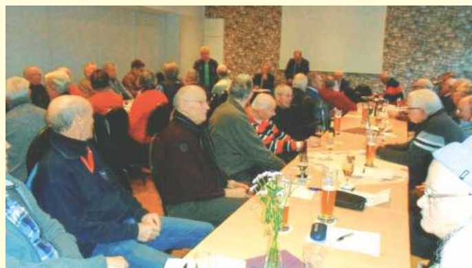
Vollbesetzter Saal.

de, was bei den Mitgliedern Bedauern auslöste. Dieter Schnarre gebührt tiefen Dank und viel Applaus und ein Geschenk der Mitglieder.