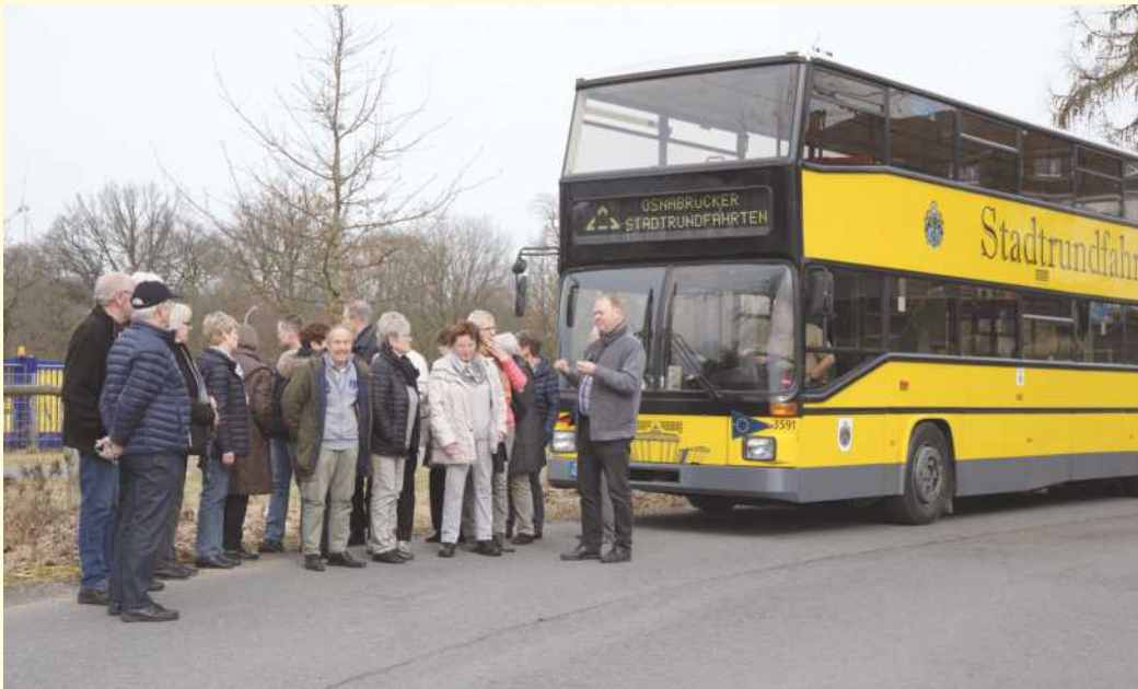
Doppeldecker auf dem Gelände der Winkelhausenkaserne (Eigentum SWO)

Die Touren zu ehemaligen Kasernengeländen finden von April bis September an folgenden Terminen statt: 15. April, 17. Juni, 19. August und 16. September. Weiterhin wird es auch die bekannten Touren geben, bei denen leichte Änderungen vorgenommen wurden: Die City Tour und die Industrie Tour starten statt 12.00 Uhr bereits um 11.30 Uhr. Die Möglichkeit eine Tour bei Nacht zu machen wird es in diesem Jahr an folgenden Terminen geben: 13. April, 27. April, 19. Oktober und 02. November. Informieren können sich Interessierte über die Stadtrundfahrten, einem gemeinsamen Projekt des Traditionsbusvereins, der OMT, Zeitseeing und der Stadtwerke Osnabrück unter www.swo.de/stadtrundfahrten , wo auch einfach und schnell die Möglichkeit geboten wird die Karten online zu bestellen.