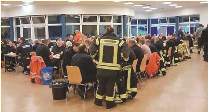
Die Mensa der BBS Meppen wurde zum Bereich für die Verpflegungseinnahme der zahlreichen Einsatzkräfte.

Noch am gleichen Nachmittag wurde im Rahmen des Katastrophenschutzes über den DRK-Landesverband in Hannover der „Betreuungsplatz 500 Land“ durch das Niedersächsische Innenministerium alarmiert. In Absprache mit dem Landkreis Osnabrück stellte der Kreisverband eine Führungsgruppe, eine Betreuungsgruppe und eine Verpflegungsgruppe.