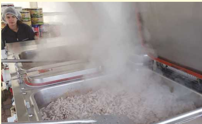
Nach dem „Schnellangriff“ am Freitagabend dampften in der Feldküche des DRK auch Köstlichkeiten wie Geschnetzeltes.

Diesem Auftrag folgend, setzte sich ab 15 Uhr eine Gesamteinheit aus etwa hundert Einsatzkräften und 30 Fahrzeugen aus ganz Niedersachsen in Bewegung – darunter auch zwei Reisebusse für den Fall der Evakuierung. 35 der insgesamt in Meppen anrückenden Einsatzkräfte gehörten dem DRK Kreisverband Osnabrück-Land an (darunter Helfer der Ortsvereine Holzhausen, Borgloh, Dissen, Vehrte und Wallenhorst). Stolz 15 Ehrenamtliche stellte alleine das DRK Bissendorf bis zum Einsatzen am Mittwochnachmittag.