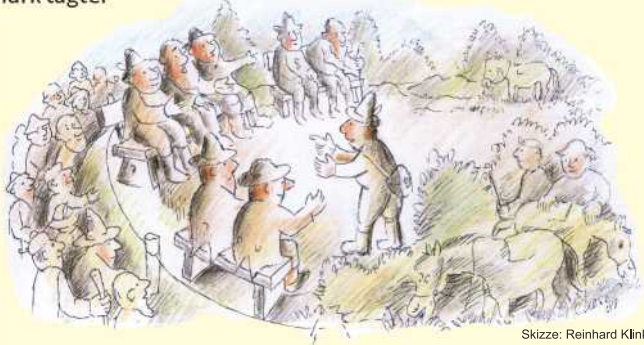
Skizze: Reinhard Klink

Zur 950-Jahr-Feier der Ortschaft Nemden hatte sich der Heimat- und Wanderverein Bissendorf (HWVB) ein ganz besonderes Geburtstagsgeschenk ausgedacht: Die Wiederherrichtung der „Höltingbänken“, einer mittelalterlichen Gerichtsstätte auf dem Kurrel, wo einst unter freiem Himmel das Holzgericht der Holter Mark tagte.