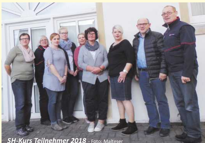
SH-Kurs Teilnehmer 2018

bei ihren patientenbezogenen Aufgaben? Antworten und eine intensive Vorbereitung auf die Begegnung mit pflegebedürftigen Menschen erhielten in der letzten Septemberwoche sechs neue Absolventen für die Ausbildung zur Schwestern-HelferIn beim Malteser Hilfsdienst in Melle.