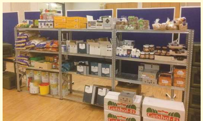
Das Trockenlager für zukünftige Essen barg alles in großen Mengen. Unten rechts lagern alleine 600 frische Eier für das Frühstück.

Da die Feuerwehrleute 36 Stunden im Einsatz waren, steuerte der DRK Landesverband aus Hannover für die Nacht rund 500 Feldbetten hinzu. Im Verlauf des Wochenendes, an dem zum Beispiel auch Kassler mit Sauerkraut und Kartoffelbrei oder Gulasch mit Semmelknödeln zubereitet und ausgegeben wurden, galt es fortan, teils im Schichtwechsel, ausreichend weitere Helfer zu stellen.