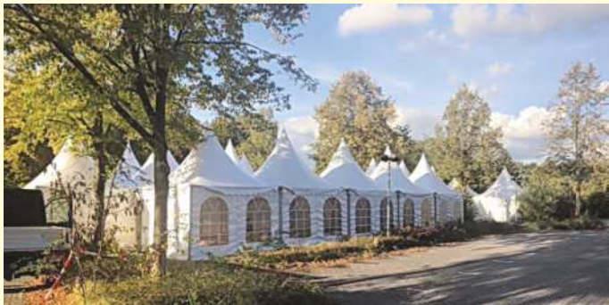
Pagodenzelte für den Fall eventuell weiterer benötigter Verpflegungen.

Da die Mensa zu Donnerstag auch geräumt werden sollte, wurden als Ausweichquartiere für eventuell weitere benötigte Verpflegungen zusätzlich Pagodenzelte errichtet. Mittwochnachmittag (einen Tag bevor der Katastrophenfall im Emsland offiziell aufgehoben wurde) wurde der Einsatz jedoch beendet. Auch der Ortsverein Bissendorf verlor daraufhin unter der Führung von Gerit Höhle sein gesamtes Material und verließ den Einsatzort samt ELW, Küchen-LKW mit Feldküche, Bulli und Betreuungsanhänger.