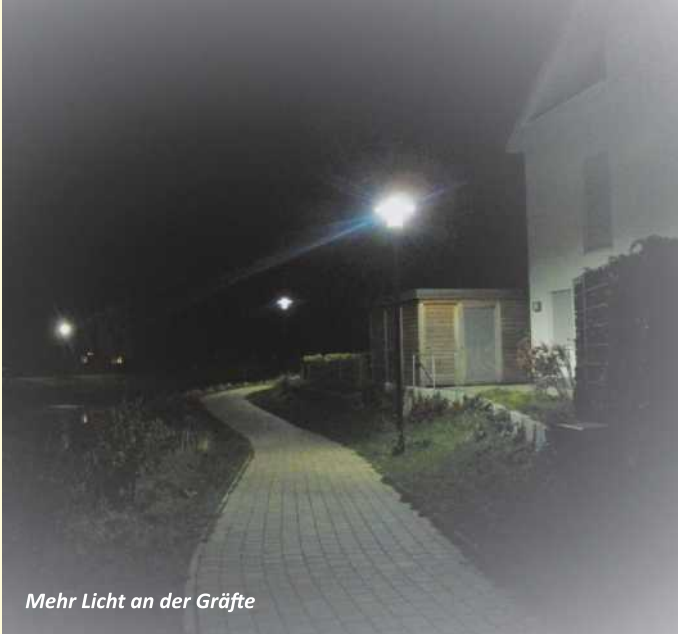
Mehr Licht an der Gräfte