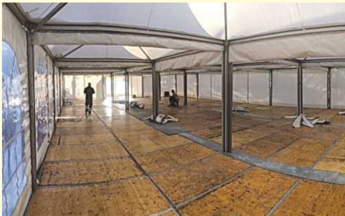
Innenansicht der aufgebauten Pagodenzelte.