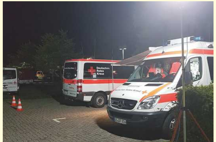
Der Einsatzleitungsbereich des „Betreuungsplatz 500“ war komplett in der Hand des DRK Kreisverbandes Osnabrücker-Land (50 Prozent davon waren Helfer aus Bissendorf).

Nach den notwendigen Erkundungen am Einsatzort, errichteten die Helfer des DRK-Kreisverbandes Osnabrück-Land gemeinsam mit den anderen DRK-Einheiten den „Betreuungsplatz 500 Land“ in den Berufsbildenden Schulen Meppen und gingen mit der Unterkunft und dem Verpflegungszentrum in Betrieb. Zum Auftakt bereitete die Verpflegungsgruppe nach zahlreichen Zukaufen vor Ort quasi im „Schnellangriff“ mehr als 400 Portionen Erbsensuppe aus der Feldküche zu. Dazu gab sie Warm- und Kaltgetränke für die aus dem Einsatz zurückgekehrten Feuerwehrleute aus.