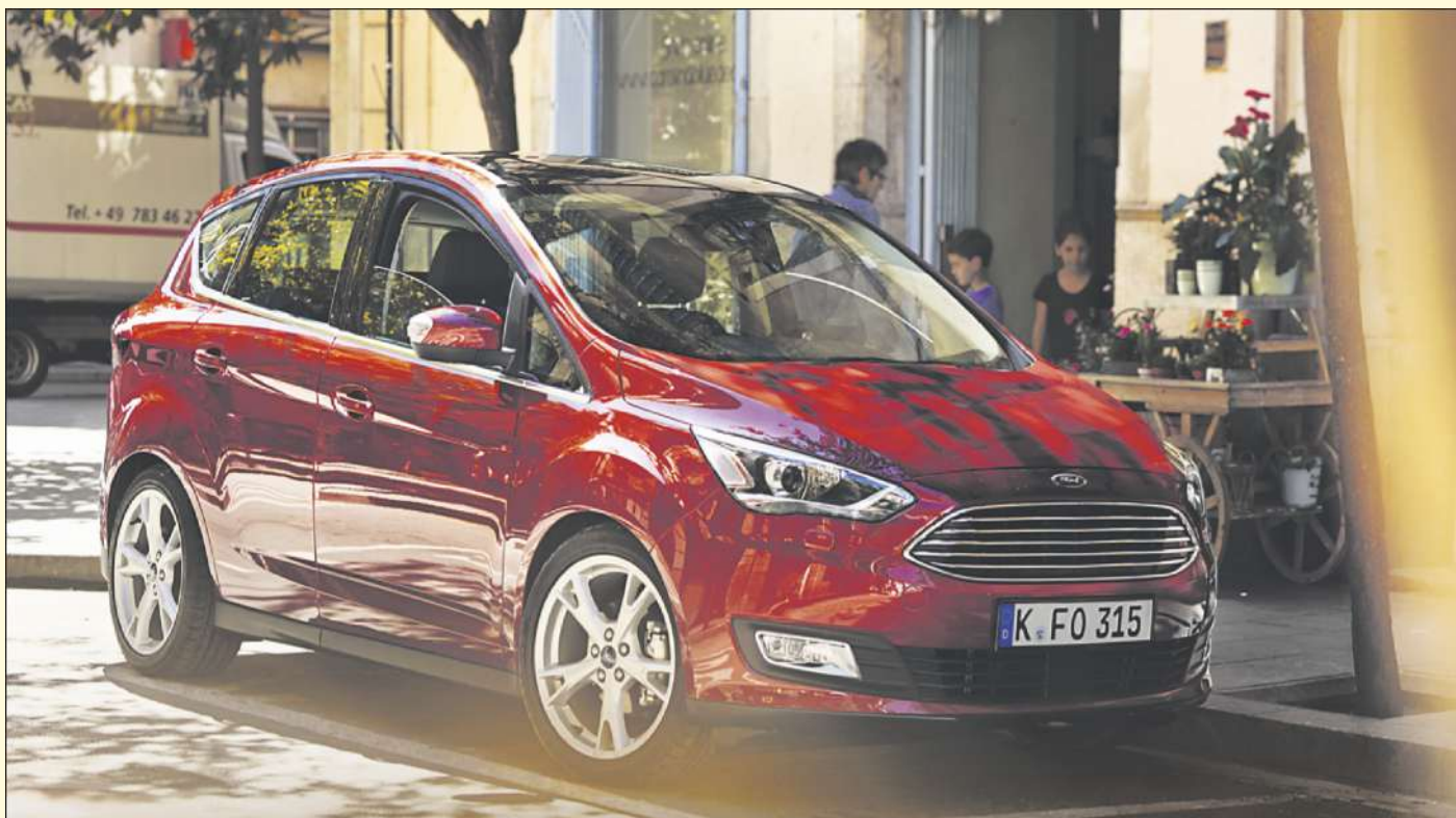
Abbildung zeigt Wunschausstattung gegen Mehrpreis.