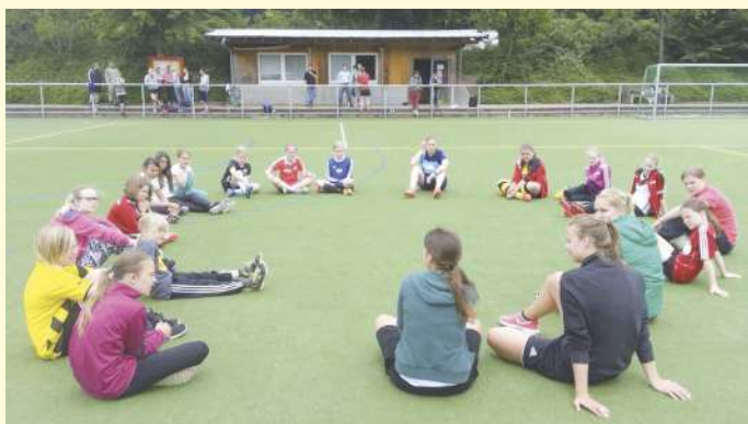
„Teamarbeit im Freien – aufmerksame Mädchen bei der Trainingsanleitung“

Ab dem 11.09. 2015 wird die Mannschaft jeden Freitag um 17:30 Uhr auf dem Rasenplatz in Wissingen trainieren. Ob Anfängerinnen oder bereits durchtrainierte Mädchen, für alle ist Platz in dieser neuen Initiative der SG. Egal, welches Alter und egal, wieviel Fußballerfahrung Frau mitbringt, jedes Mädchen ist hier herzlich willkommen. Sport und Spaß am Spiel stehen im Mittelpunkt der Trainingseinheiten – Neu-Interessierte, erfahrene Goalgetter sind herzlich willkommen, damit sich aus diesen ersten Gruppen bald weltmeisterliche Mädchenteams entwickeln. Ziel ist es, zur Rückrunde ein oder mehrere Mannschaften im festen Spielbetrieb zu melden.