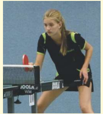
Volle Konzentration bei der Annahme, um im Return schnell auf Angriff umschalten zu können!

Für einen reibungslosen Ablauf des Turniers sorgten an zwei Tagen zahlreiche Helfer der Abteilung TT. Dabei zeigten sowohl die Nachwuchsspieler, deren Eltern und auch die Erwachsenen, wie sie alle gemeinsam für den Verein einstehen. Sowohl der Auf- und Abbau der Tische als auch des gesamten Spielzubehörs liefen reibungslos ab, ebenso wie die Verpflegung von Spielern und Zuschauern mit Kaffee, Kuchen, belegten Brötchen und weiteren Leckereien. Besonders hervorzuheben sind aber sicher die etwa 20 Aktiven, die als Schiedsrichter fungiert haben und eifrig alle Spiele unter höchster Konzentration gezählt haben. Bald schon folgt die nächste große TTZ-Veranstaltung des SV 28 Wissingen: Der Goldene Schläger wird Anfang Januar 2016 zum 41sten mal ausgespielt! Mehr dazu bald auf www.sv28wissingen.de .